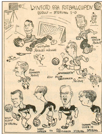
Karikatur fra Arbeiderbladet fra finalen i 1939.

– Ja, det var det avgjort. Fra de første klubbene ble stifta rundt 1890 var det særlig unge folk som var med, gutter helt ned i 11-12-års-alderen. Tenk deg, et lag som Lyn ble stifta i 1896 av 12-14-åringene. Så det er klart det kunne gå temmelig hardt for seg når de var så unge