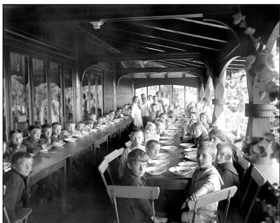
Fra Dagkolonien på Frognerseieren 7. juni 1919.

Det skrev Dagbladet 11. juni i 1881. På den tid var ferie et fremmedord og i Kristiania, som med den industrielle revolusjonen var blitt en storby på rekordfart, lekte barna i slummen hele sommeren mes foreldrene jobbet. De var, som det ble skrevet i Dagbladet, >>