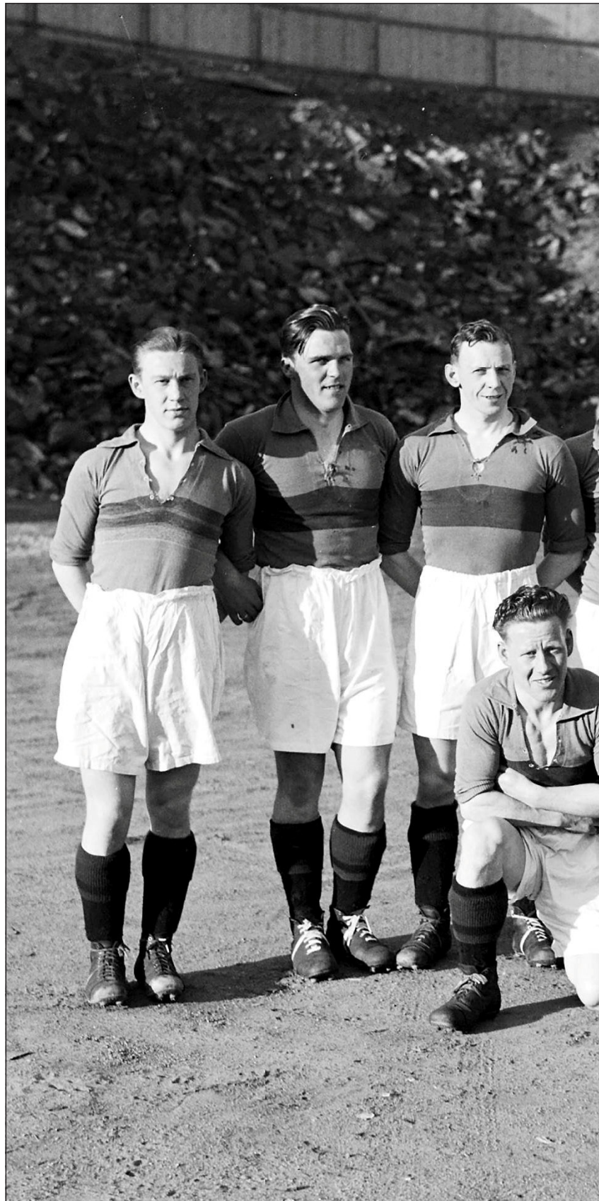
VIF fotografert dagen før de vinner Feriecupen i 1935 - det siste laget som