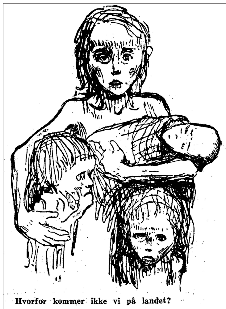
Hvorfor kommer ikke vi på landet?