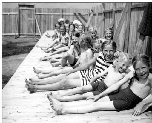
Fra Solkolonien på Ekeberg 1915, feriested for såkalt «Særlig Svaglige Piker».