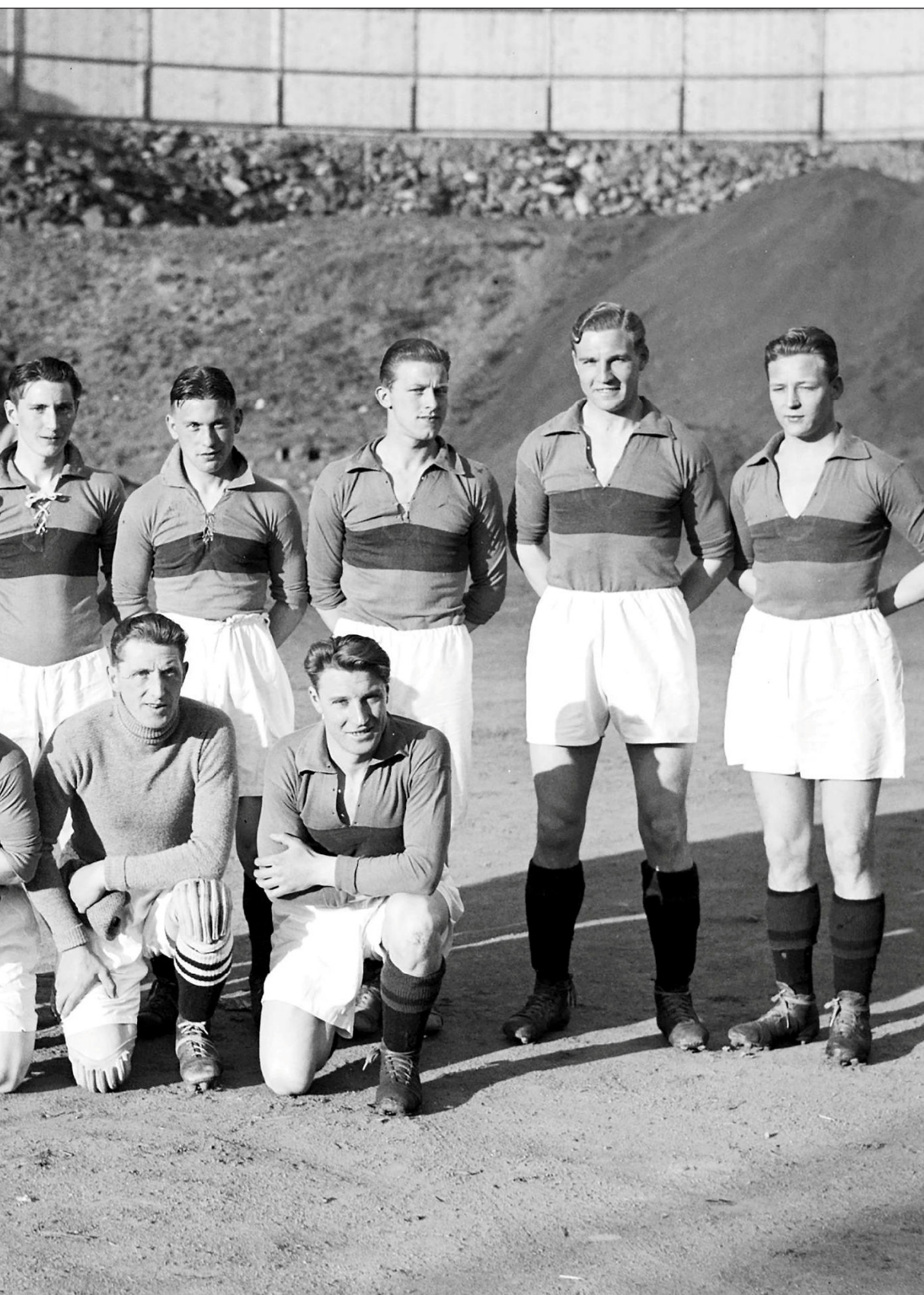
vant turneringen på Bislet før den ble flyttet til Frogner Stadion fra 1936.