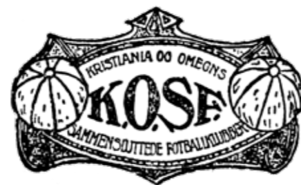
Logoen til K&OSF som ble benyttet 1916-1917.

on skulle flyttes (pga. den enorme Norges Jubileumsutstilling som skulle åpne 15. mai 1914) og at man i denne perioden kun hadde en uferdig Bislet Idrettsplass som nærmest fullgod arena. Men østkantfotballen ga seg ikke og den 3. juni 1914 stiftet de en egen krets: Kristiania & Omegn Sammen-sluttede Fotballklubber (K&OSF).