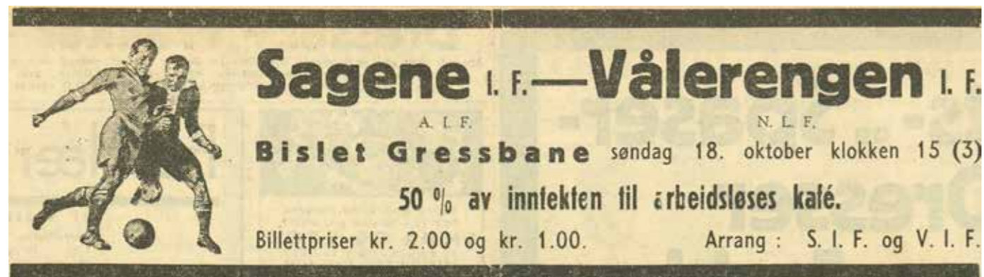
Forliksskamp var et nyord i 1936. Annonser for noen slike fotballkamper i Oslo 1936-1939.

Det som er tydelig er at østkant-fotballen fikk et enormt oppsving i perioden 1920 og frem mot krigen. Ikke bare i AIF, men også på borgerlig side. Strong fra Grünerløkka ble bl.a. A-klasse-mester i 1929 mens VIF ble mestere i 1927 samt i 1932-1934. Og Skeid ble et av Norges beste lag mot slutten av 30-tallet og var i cupfinalene i 1939-40. Østkanten hadde erobret fotballen i Oslo.